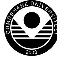
Siyah Renk Kullanımı