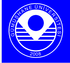
Lacivert Zemin Kullanımı