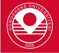
Kırmızı Zemin Kullanımı