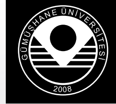
Siyah Zemin Kullanımı